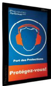
Exemple de pictogramme