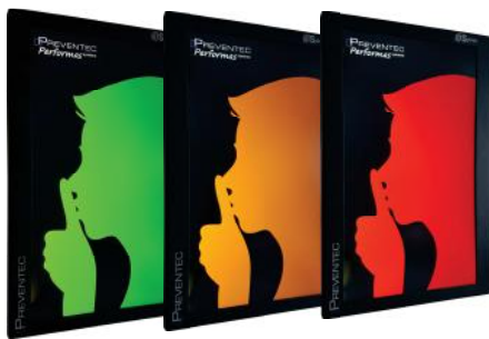
Acceptable Préoccupant Trop élevé premier seuil deuxième seuil